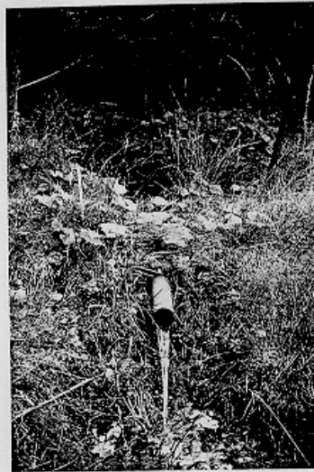
Abb. 3. Ausschnitt aus einem natürlich entstandenen Feuchtraumbiotop am Standort Schlema-Alberoda. An dieser Stelle findet eine Arsen- und Urananreicherung unter natürlichen Bedingungen statt.

Bei ersten Untersuchungen stellte sich heraus, daß sich am Fuß einer Halde bereits ohne äußeres Zutun ein circa 200 m 2 großes Feuchtraumbiotop herausgebildet hat. Abbildung 3 zeigt